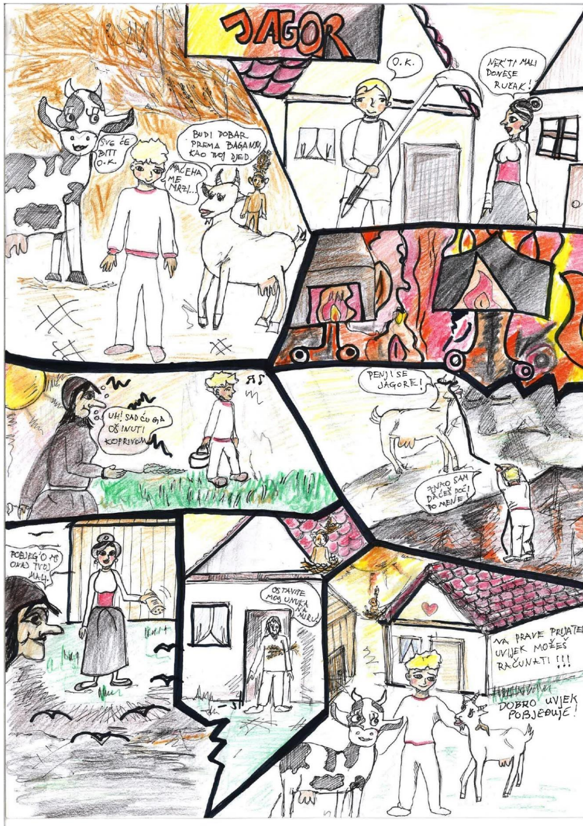
Frida Rakoša, 5. razred, Osnovna škola Viktorovac, Sisak