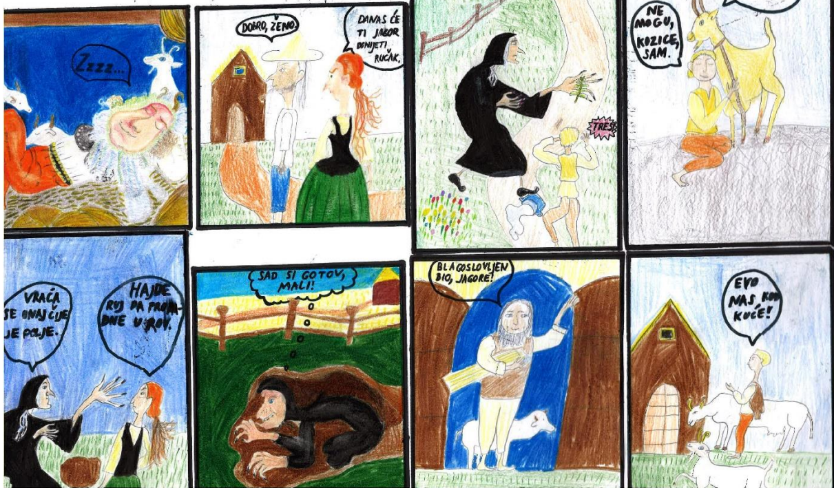
Lana Komes, 5 razred, Osnovna škola Stjepana Basaričeka Ivanić-Grad